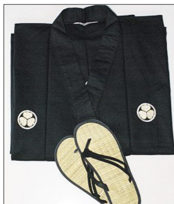
Für ihr Projekt hat Pape Materialien aus Bambus zusammengetragen.

ruth.marending@gastroneus.ch Weitere Bilder zur Preisverleihung des Titels Hauswirtschaftsprofi 2010: www.expresso.ch