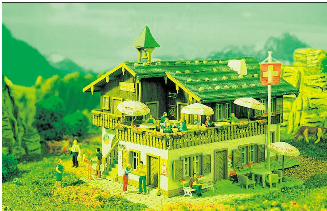
Un hôtel de montagne n'est pas automatiquement un établissement saisonnier. La Convention collective nationale de travail définit exhaustivement les critères auxquels un hôtel ou un restaurant obtient ce statut.